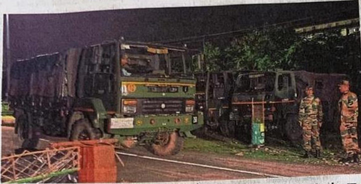
Indian Army personnel near border checkpost, at Fulbari near Siliguri district, Monday.

According to a statement, Chawdhary was first briefed on the "strategic scenario and operations" of the Eastern Command. He then went to Dhamakhali, in North 24 Parganas, where the commandant briefed him on the battalion's water border responsibilities. He also visited an outpost in the Sunderbans.