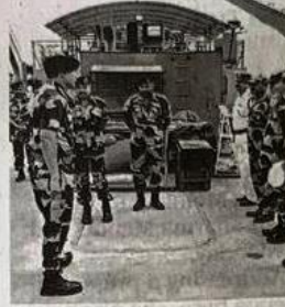
BSF D-G Daljit Singh Chaudhary visits Indo-Bangladesh border in North 24 Parganas district.

"We are in touch with BGB but there has been no build up of people at the border as of now. Extra personnel have been deployed and there is heightened alert. All formations have been conveyed the Centre's decision to not allow anyone into India without proper documents,"