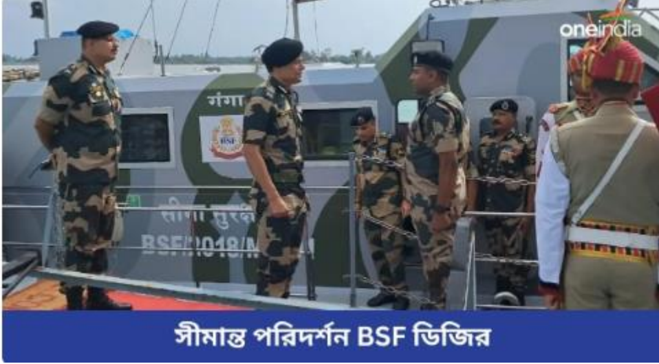
সীমান্ত পরিদর্শন BSF ডিজির

সেনাবাহিনীর হাতে বাংলাদেশ! অপারেশনাল প্রস্তুতি পর্যালোচনায় সীমান্ত পরিদর্শন BSF ডিজির