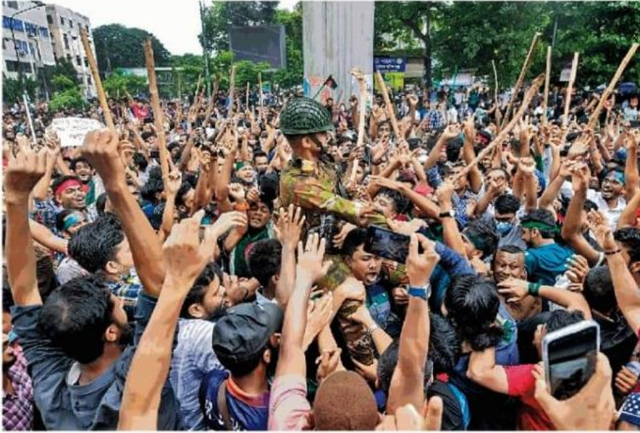
बांग्लादेश के प्रधानमंत्री पद से इस्तीफा देने के बाद हसीना के त्यागपत्र पर सोमवार को ढाका में एक सैनिक को कंधे पर बैठाते के साथ खुशी मनाते प्रदर्शनकारी।

सबसे विश्वस्त वैश्व साइबर स्त्री है हसीना : पूरी दुनिया में कोई एक वैश्विक नेता जिस पर भारत आँख मूंद कर भरोसा कर सकता था, वह बंग-बंगु शेरख मुजीबुर्रहमान की पुत्री शेरख हसीना थीं। चाहे पूर्व पीएम मनमोहन सिंह की बूपीए-दो का कार्यकाल हो या विगत 10 वर्षों से पीएम नरेन्द्र मोदी की सरकार हो, शेरख हसीना ने हमेशा भारतीय हितों का खयाल रखा। उन्होंने पाकिस्तान खुफिया एजेंसी आइएसआइ के नेटवर्क और पाक की मदद से फल-फूल रहे भारत विरोधी कट्टरपंथियों की दुकानें बंद करवाईं। वही से ढाका व काक्सबाजार में छिपकर रहने वाले असम के आतंकियों का सफाया कराया। उन्होंने पाक समर्थित आतंकवाद के मुद्दे पर सार्क व दूसरे मंचों पर हमेशा भारत का साथ दिया। जश्न है कि अब इस पड़ोसी देश में जो भी नई सरकार आएगी, उसके साथ भारत का पुराना भरोसा बनाने में समय लगेगा। भारत ने भी हसीना के हितों का खयाल रखा। कभी वहाँ के अंदरूनी हालात में दखल नहीं दी। 2015 में सीमा विवाद विषयक भारत कतने के साथ ही 40 वर्ष पुराने विवाद का निपटारा किया। बांग्लादेश को कई सड़कों, रेल मार्गों, ऊर्जा परियोजनाओं का