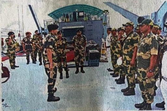
अधिकारियों के साथ बीएसएफ महानिदेशक चौधरी और अन्य।

सीमा पर बढ़ाई सुरक्षा : बांग्लादेश में बदले हालात के मद्देनजर बीएसएफ ने भारत