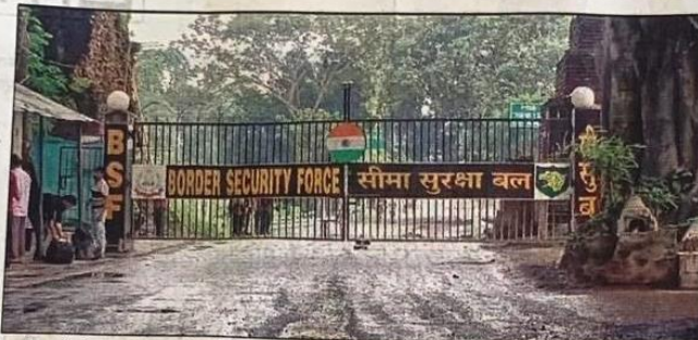
महदीपुर में बंद पड़ा भारत-बांग्लादेश बॉर्डर का गेट

मालदह : बांग्लादेश की प्रधानमंत्री शेख हसीना के सोमवार दोपहर को देश छोड़ने के बाद पुरे देश में अराजकता का माहौल उत्पन्न हो गया है। बांग्लादेश में सेना उतार दी गयी है। स्थिति पर नजर रखते हुए सुरक्षा कारणों से मालदह के इंग्लिश बाजार ब्लॉक के महदीपुर इलाके में भारत-बांग्लादेश अंतरराष्ट्रीय व्यापार सीमा को फिलहाल बंद कर दिया गया है। बांग्लादेश की अराजक स्थिति के बीच पनामा बंदरगाह में करीब 150 भारतीय ट्रक ड्राइवर व खलासी फंसे हुए हैं।