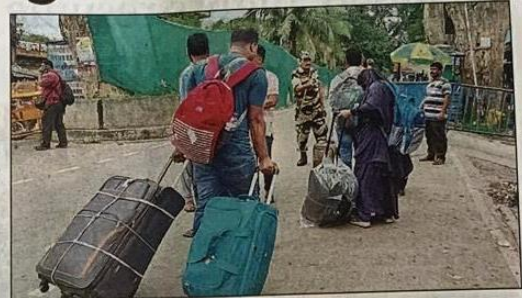
(L) Patrolling at the India-Bangladesh border; (R) visitors at the Petrapole check-post

closer to the ICPs though they would not take up positions at the borders. "They will be on a standby behind the BSF personnel, ready for any emergency," said a source, adding Army movement had taken place at Phulbari in Jalpaiguri. "Security along the India-Bangladesh border has been stepped up to thwart infiltration. Since July 18, the BSF has been facilitating the entry of Indian students and it will continue. All our officers from the headquarters—commandants and above—have been moved to the border posts to